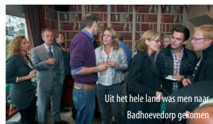
Uit het hele land was men naar Badhoevedorp gekomen