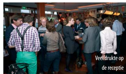
Veel drukte op de receptie